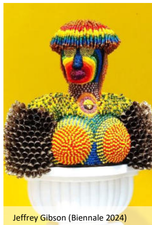
Jeffrey Gibson (Biennale 2024)

heute den idealen Raum für großformatige Installationen und Performances. Der Nachmittag steht zur freien Verfügung. Die Biennale lebt von und an den verschiedensten dezentralen Orten innerhalb der Stadt. Diese vielfältigen Erlebnisse sollte man nach eigenem Gusto entdecken. Verteilt auf verschiedene Palazzi – die in Venedig „Casa“ genannt werden – findet man sowohl weitere Länder-Pavillons als auch Sonderausstellungen. Abends treffen wir uns zum Abschiedsessen in einer Trattoria.